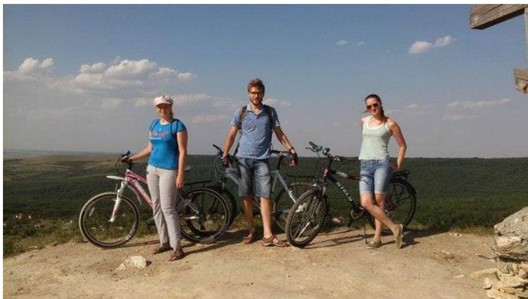
Велопокатушки до креста.

Как любящий муж и отец, с большим наслаждением пишу картины, на которых стараюсь запечатлеть жену и детей.