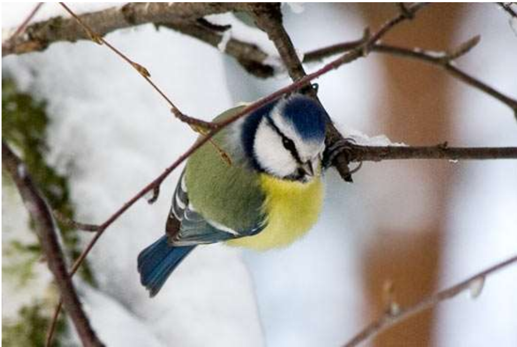
Красивая синичка – лазоревка.