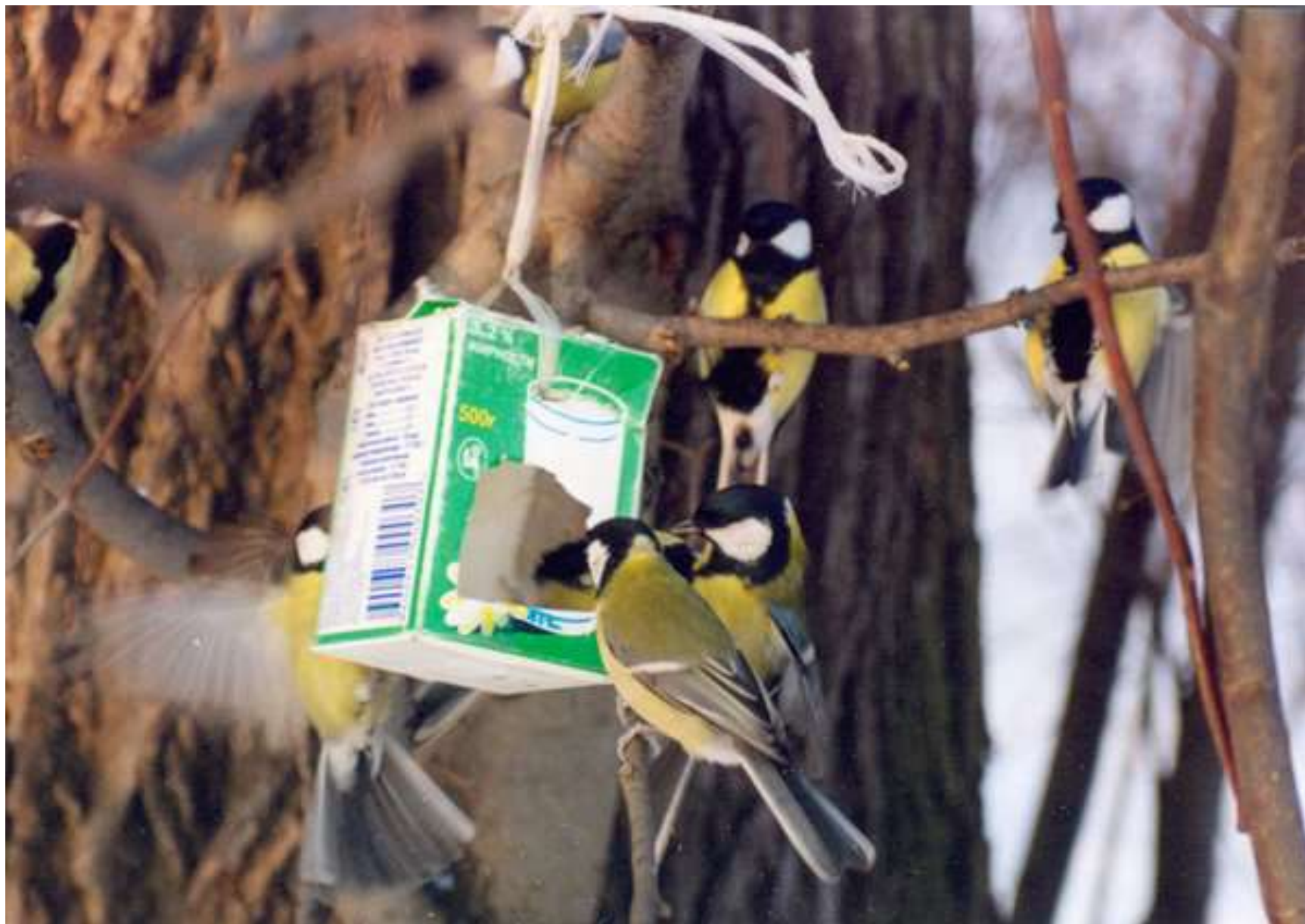
Перед стайкою синиц.